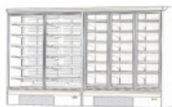
TN P - BT