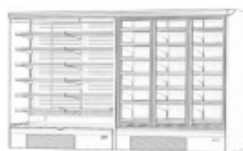
TN - BT